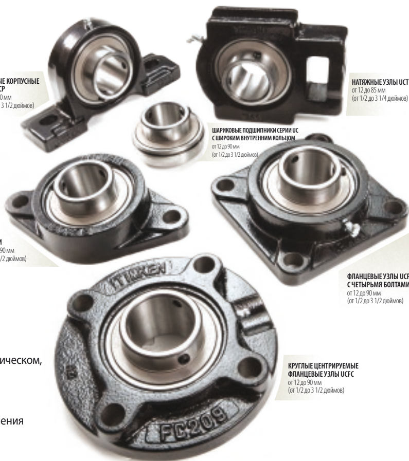
КРУГЛЫЕ ЦЕНТРИРУЕМЫЕ ФЛАНЦЕВЫЕ УЗЛЫ UCFC от 12 до 90 мм (от 1/2 до 3 1/2 дюймов)