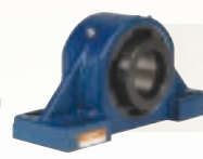
НЕРАЗЪЕМНЫЕ КОРПУСНЫЕ УЗЛЫ СО СФЕРИЧЕСКИМИ РОЛИКОВЫМИ ПОДШИПНИКАМИ Надежная защита, высокие рабочие характеристики