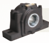
ОПОРНЫЕ КОРПУСНЫЕ УЗЛЫ SAF Оптимальная грузоподъемность и продолжительный срок службы