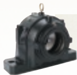
КОРПУСНЫЕ УЗЛЫ SNT Адаптируемое решение, высокая эффективность

Все корпусные узлы легко взаимозаменяемы с другими узлами стандартной для отрасли конструкции.